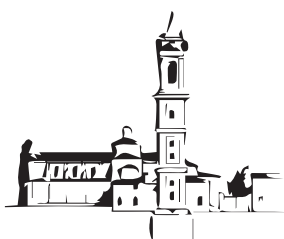
Parrocchia san Mamante di Medicina

Sabato 12 maggio 2018 ore 16.30 in sala Giovanni Paolo II nella parrocchia di san Mamante di Medicina (BO).