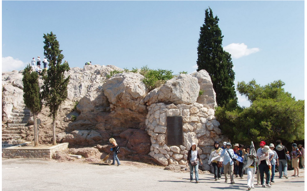
Pellegrinaggio parrocchiale sulle orme di S. Paolo 2007 AEROPAGO: luogo che ricorda il discorso di S. Paolo

Colui che, senza conoscerlo, voi adorate, io ve lo annuncio.